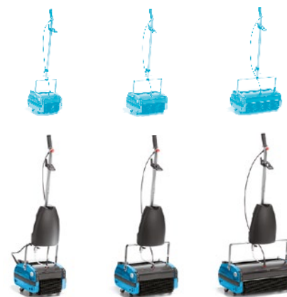
R20 / R20T R30 / R30T R45 / R45T