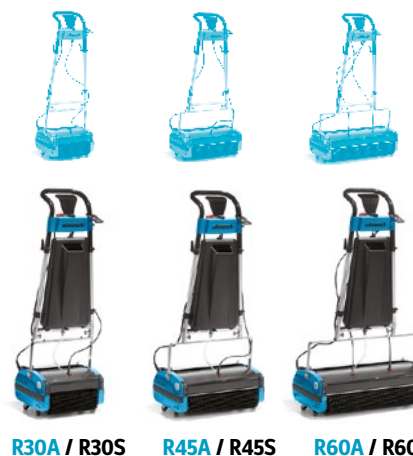
R30A / R30S R45A / R45S R60A / R60S